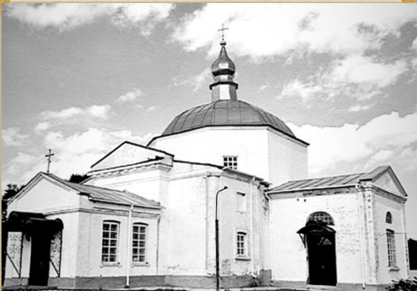
Украина, Киевская обл., Теплиевский район, с. Пятигоры