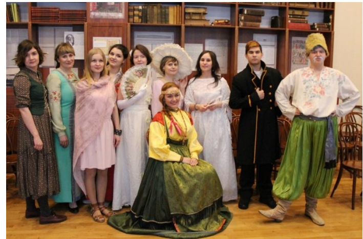
Проект «Чтение без границ». 14 мероприятий/ 232 чел.