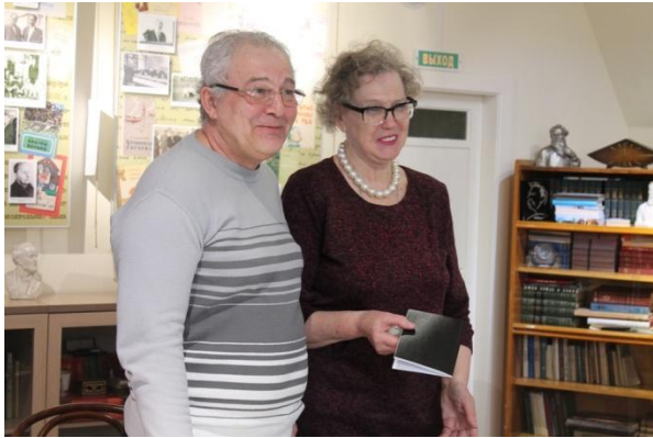
Литературная среда. 29 мероприятий/ 1075 чел.