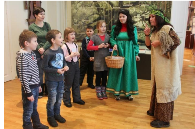
Антикафе «В гостях у сказки». 63 мероприятия/ 538 чел.