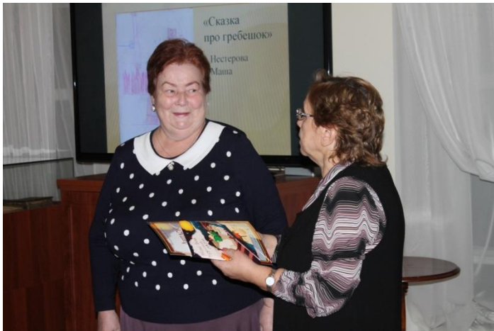
«Творческая площадка «Сказочник & ART» . 11 мероприятий/198 чел.